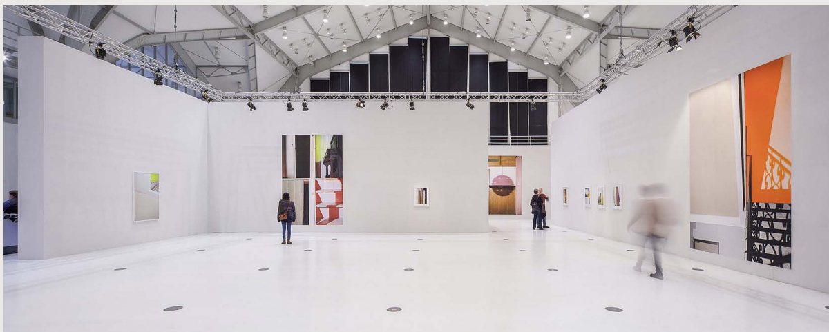
Installation bei gute aussichten, Deichtorhallen Hamburg, 2015