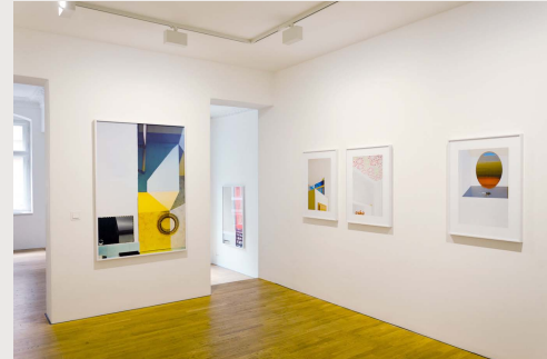
Installation, Robert Morat Galerie, 2016