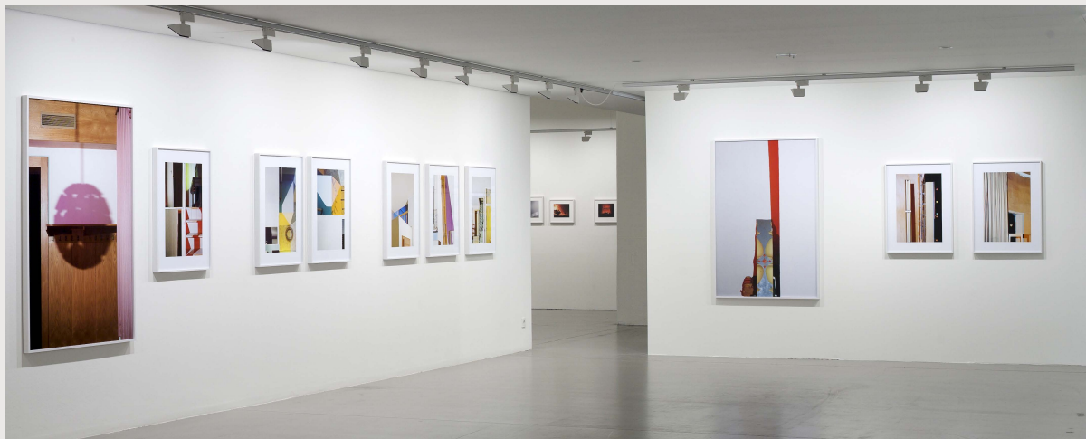
Installation, Marta Herford, gute aussichten, 2014